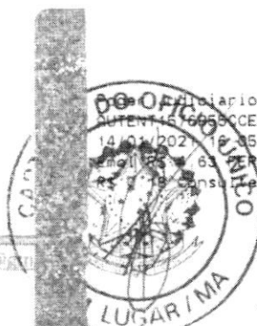
Marlene Silva Miranda Prefeita Municipal

Ofício Tjma Selo AUTENT. 6655CCEEBTV1QHDLE42 14/01/2021 10:05:38, Ato: 13 18, Total R$ 5,12 Imp. R$ 0,63 PERC R$ 0,13 FADEP R$ 0,18 FEMP R$ 0,18 Consulta em https://selo.tjma.jus.br