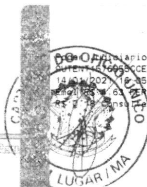
Marlene Silva Miranda Prefeita Municipal

Diário TJMA Selo AUTENT. Nº 6953CCEEBTV1QHDLE42 14/01/2021 16:05:38, Ato 1318, Total R$ 5.12 Impo R$ 0.63 MERC R$ 0.13 FADEP R$ 0.18 FEMP R$ 0.18 Consulta em https://selo.tjma.jus.br