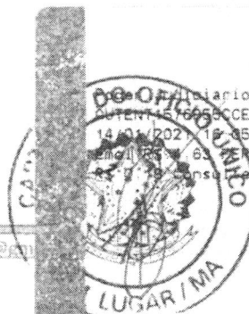
Marlene Silva Miranda Prefeita Municipal

Diário TJMA Selo AUTENT. LE 16050CCEBTV1QHDLE42. 14/01/2021 10:05:38. Ato 13 18 Total R$ 5,12 R$ 1,83 FERC R$ 0,13 FADEP R$ 0,18 FEMP R$ 7,19 consulte em https://selo.tjma.jus.br