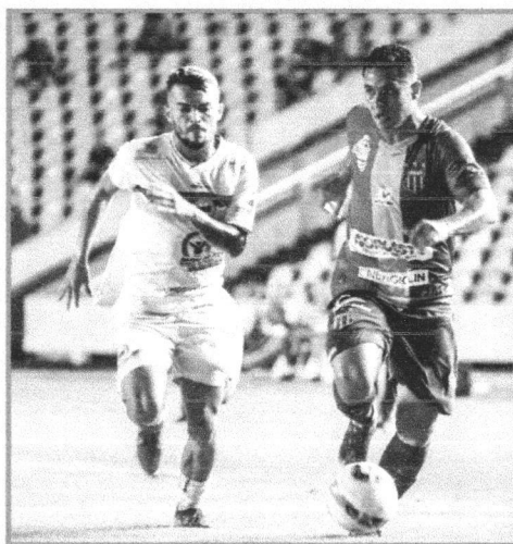
PARÁ VOLTOU A JOGAR NA PARTIDA CONTRA A CHAPECOENSE

A partida entre Sampaio e Ituano será realizada neste sábado, no estádio Castelão. O confronto está marcado para às 18h30.