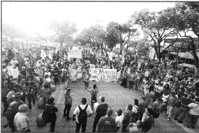
GRUPO PRÓ GOVERNO FOI ÀS RUAS PARA PEDIR RESPEITO À DEMOCRACIA

O anúncio foi feito em entrevista coletiva concedida nesta segunda-feira (9). O governador explicou que a comitiva maranhense, deve ir ao DF nesta terça-feira e se juntar a mais 48 que