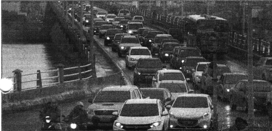
VALE DESTACAR QUE O MOTORISTA NÃO DEVE DIRIGIR COM HABILITAÇÃO VENCIDA APÓS A TOLERÂNCIA DE 30 DIAS

A divulgação nacional de dados sobre o prazo de renovação da Carteira Nacional de Habilitação (CNH), referentes a outros estados, gerou dúvidas a muitos condutores maranhenses.