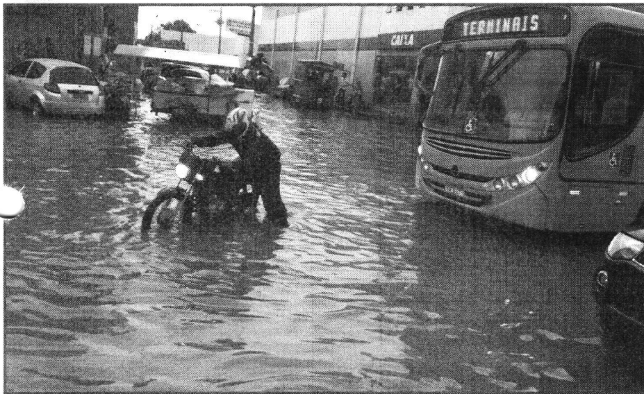
AS FORTES CHUVAS QUE CAIRAM NA NOITE DE SEGUNDA-FEIRA DEIXARAM MUITOS LOCAIS DE SÃO LUÍS SOB AS ÁGUAS.

Cerca de dez famílias, residentes no bairro do Anil, em São Luís, estão sendo aconselhadas pela Defesa Civil de São Luís a deixarem suas casas, devido às fortes chuvas ocorridas na capital, nas últimas horas.