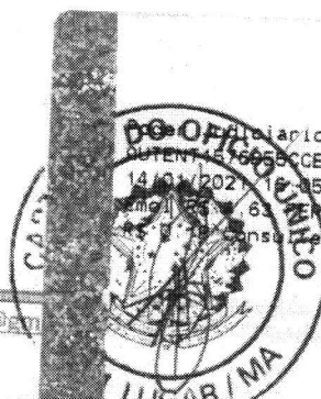
Marlene Silva Miranda Prefeita Municipal

Brasão do Município TJMA Selo AUTENT. 1676990CCEEBTV1GHDL42. 14/01/2021 16:45:38, Ato: 3 18, Total R$ 5,12 FEMP R$ 0,63 FENC R$ 0,13 FADEP R$ 0,18 FEMP R$ 4,18 Consulte em https://selo.tjma.jus.br