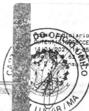
Marlene Silva Miranda Prefeita Municipal

Procuradoria TJMA Selo: AUTENT: 6576055CCEEBTV1QHDLE42, 14/01/2021 12:35:38, Ato: 13.18, Total R$ 5,12 Imp: R$ 63, FERC R$ 0,13 FADEP R$ 0,18 FEMP Para mais informações consulte em https://selo.tjma.jus.br