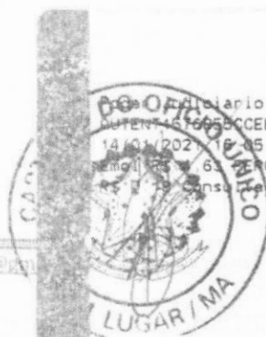
Marlene Silva Miranda Prefeita Municipal

Diário TJMA Selo AUTENT. 151665BCCEEBTV10HDLE42 14/01/2021 16:05:38. Ato: 13 18. Total R$ 5,12 Remol R$ 6,30 FERC R$ 0,13 FADEP R$ 0,18 FEMP R$ 1,79 Consulte em https://selo.tjma.jus.br