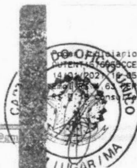
Marlene Silva Miranda Prefeita Municipal

Funcionario TJMA, Selo AUTENT. 16666CCEEBTV1QHDLE42 14/01/2021 16:35:38, Ato: 13 18, Total R$ 5,12 R$ 0,13 FISC R$ 0,13 FADEP R$ 0,18 FEMP R$ 0,18 CONSUL em https://selo.tjma.jus.br