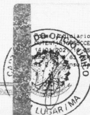
Marlene Silva Miranda Prefeita Municipal

Oficialário TJMA Selo AUTENT. 157655CCEBTV1GHDLE42. 14/01/2021 10:25:39, Ato: 13 18, Total R$ 5,12 R$ 2,13 FISC R$ 0,13 FADEP R$ 0,18 FEMP R$ 2,73 Consulte em https://selo.tjma.jus.br