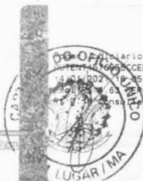
Marlene Silva Miranda Prefeita Municipal

Ofício TJMA Seio OPENT: 16065CCEBTV1QHOLE42. 14/01/2021 18:35:38, Ato: 13 18, Total R$ 5,12 R$ 0,18 FERC R$ 0,13 FADEP R$ 0,18 FEMP R$ 0,18 consulte em https://seio.tjma.jus.br