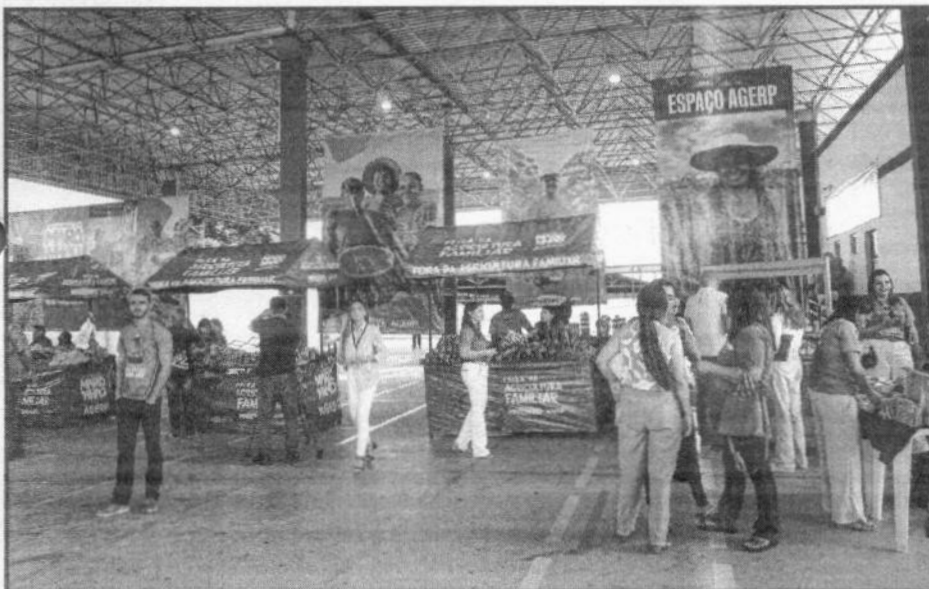
FEIRA LEVA PRODUTOS DE QUALIDADE A PREÇO ACESSÍVEIS PARA O CONSUMIDOR

A Super Feira da Agricultura Familiar aconteceu no pátio do Departamento Estadual de Transito do Maranhão (Detran), na Avenida dos Franceses