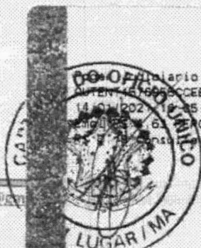
Marlene Silva Miranda Prefeita Municipal

Alvarão TJMA Selo: AUTEN: 1668CCEBTV10HDLE42 14/01/2021 12:35:38, Ato: 3 19, Total R$ 5,12 MIO: 0,00, G. FAC: R$ 0,13, FADEP: R$ 0,18, FEMP: em https://selo.tjma.jus.br