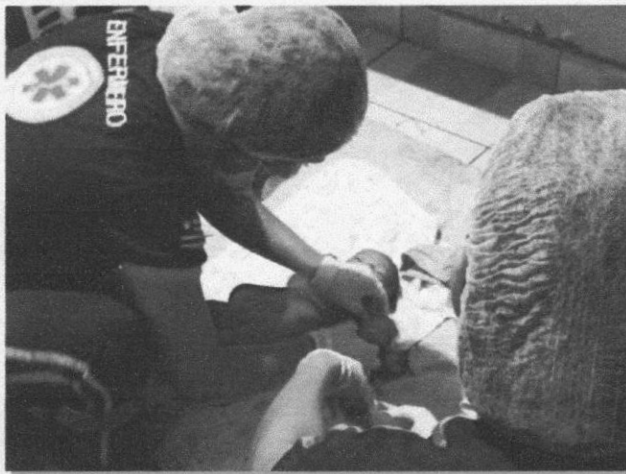
APÓS SOFRER MUITO E TER SEU FILHO EM CASA, CHEGOU O PESOAL DO SAMU PARA LEVAR A MÃE E FILHO AO HOSPITAL

Posteriormente, mãe e bebê foram encaminhados para um hospital de Imperatriz, onde receberam cuidados médicos.