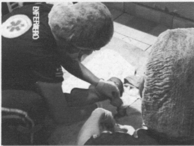
APÓS SOFRER MUITO E TER SEU FILHO EM CASA, CHEGOU O PESOAL DO SAMU PARA LEVAR A MÃE E FILHO AO HOSPITAL

Posteriormente, mãe e bebê foram encaminhados para um hospital de Imperatriz, onde receberam cuidados médicos.