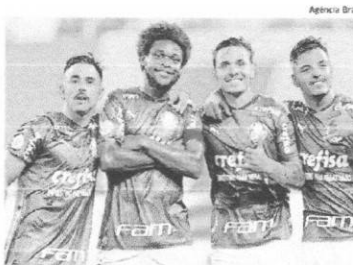
Palmeiras tem retrospecto positivo contra equipes mexicanas