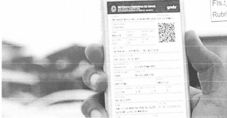
O Departamento Estadual de Trânsito do Maranhão diz que o Certificado de Registro e Licenciamento do Veículo eletrônico continua valendo

Continuam em vigor as regras da Autorização para Transferência de Propriedade do Veículo em meio digital (ATPV-e) e do CRLV-