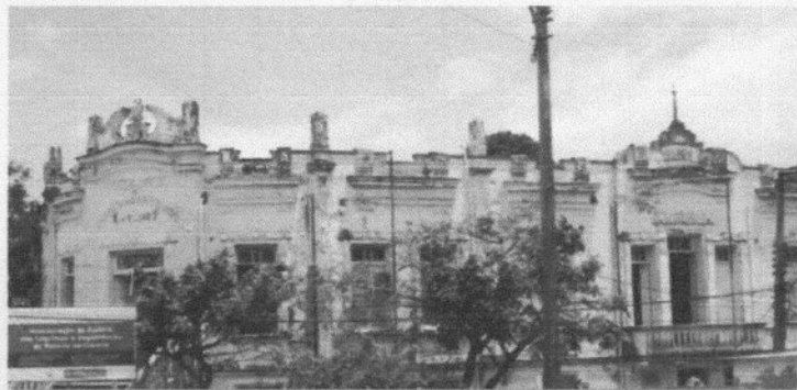
O ESPAÇO FOI UTILIZADO PELA FACULDADE DE FARMÁCIA E ODONTOLOGIA DA UNIVERSIDADE FEDERAL DO MARANHÃO POR MUITOS ANOS

A parceria entre o Iphan e a Ufma busca fortalecer tanto a preservação do Patrimônio Cultural quanto o desenvolvimento da educação, além de atrair novos investimentos em inovação e turismo no centro da capital maranhense. "O retorno do Palácio das Lágrimas representa um ganho