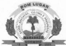
Figura 2: Recorte da Declaração