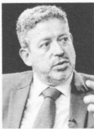
Lira diz que votação será célere

Depois, os parlamentares rejeitaram um destaque, proposta de mudança no texto principal, apresenta-