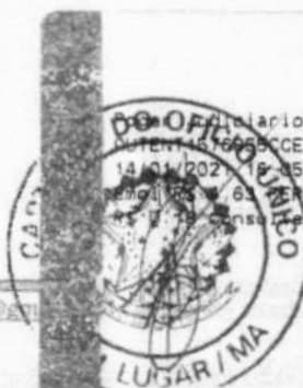
Marlene Silva Miranda Prefeita Municipal

Diário TJMA. Selo: AUTENTICO 16995CCEEBTV1QHOLE42. 14/01/2021 16:35:38, Ato: 13.18, Total R$ 5.12 PENS R$ 0,63 FERC R$ 0,13 FADEP R$ 0,18 FEMP R$ 7,38 consulte em https://selo.tjma.jus.br