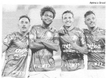
Palmeiras tem retrospecto positivo contra equipes mexicanas

O vencedor do duelo avançará para a final do torneio. O adversário será o classificado da partida entre Al-Ahly e Bayern de Munique, que se enfrentam na segunda. ■