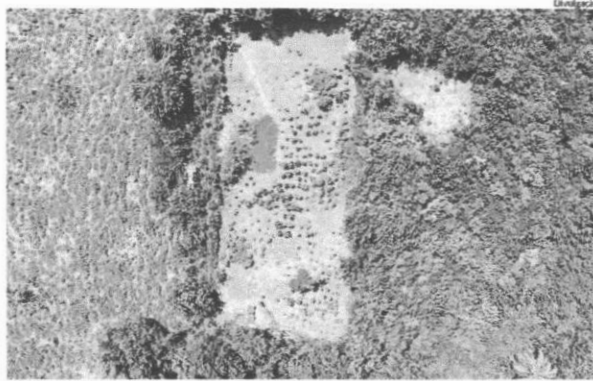
Plantação de maconha descoberta pela polícia, em Governador Eugênio Barros, na Operação Colheita