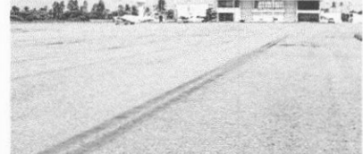
Aeroporto de Barreirinhas terá investimento federal para melhorias

A Secretaria Nacional de Aviação Civil do Ministério da Infraestrutura (SAC/MInfra) autorizou início das obras para construção de cerca de 60 mil metros quadrados de obras de melhoria do Aeroporto de Barreirinhas/MA. A melhoria faz parte da execução de um Termo de Compromisso no valor de R$ 7 milhões, firmado entre o ministério e o Governo do Maranhão, com recursos 100% federais, do Fundo Nacional de Aviação Civil (FNAC).