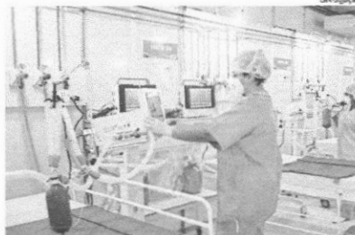
Governo do Maranhão tem 15 dias para fornecer informações oficiais

No ofício expedido pelos defensores, eles requerem que seja apresentada e comprovada a execução orçamentária e financeira dos recursos ordinários e extraordinários repassados pela União, o orçamento dos próprios estados e das prefeituras voltados ao enfrentamento da pandemia, bem como o saldo remanescente dos recursos repassados pela União até 5 de abril de 2021.