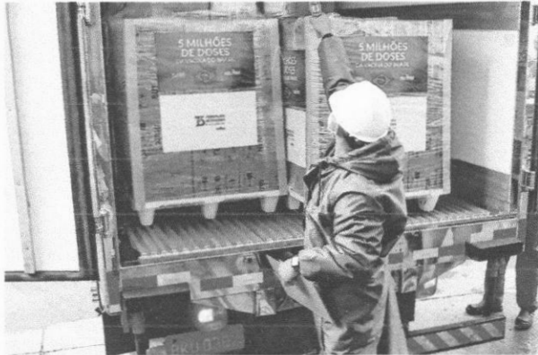
Funcionário trabalha na distribuição dos lotes de vacinas pelo Ministério da Saúde aos estados

No todo, o MS distribuiu, desta vez, a todos os estados e ao Distrito Federal, para reforço da campanha de vacinação, 4.416.550 milhões de doses, de forma proporcional e igualitária.