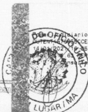
Marlene Silva Miranda Prefeita Municipal

Administrário TJMA Selo AUTENT. 576650CEEBTV1QHDL42. 14/01/2021 18:05:39, Ato: 13 18, Total R$ 5,12 R$ 0,13 FADEP R$ 0,13 FADEP R$ 0,18 FEMP R$ 0,13 FEMP em https://selo.tjma.jus.br