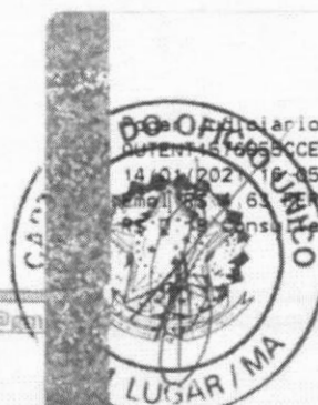
Marlene Silva Miranda Prefeita Municipal

Diário TJMA Selo AUTENT. 151665CCEBTV1GHOLE42. 14/01/2021 10:05:38, Ato: 13 18, Total R$ 5,12 Impressão R$ 6,30, MERC R$ 0,13, FADEP R$ 0,18, FEMP R$ 7,73. Consulte em https://selo.tjma.jus.br