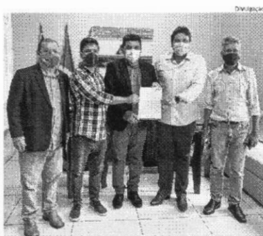
Presidente Edmar Nabarro e demais dirigentes protocolam o ofício

“O comércio de Imperatriz tem muita força e é a fonte de emprego mais forte que a cidade tem. Então se protegermos os trabalhadores do comércio, estaremos prote-