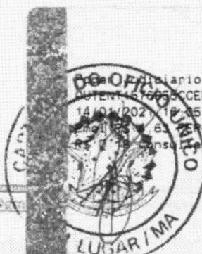
Marlene Silva Miranda Prefeita Municipal

Carimbo do Selo do Município de Bom Lugar, Maranhão, 14/01/2021, 10:35:38, Ato: 1318, Total R$ 5,12 Empl: R$ 0,13 FISC R$ 0,13 FADEP R$ 0,18 FEMP R$ 3,58 Consulte em https://selo.tjma.jus.br