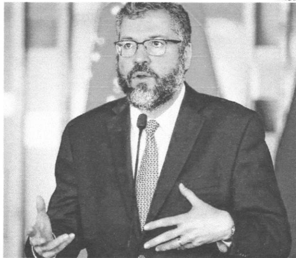
Até o fim de semana, a única saída dada como certa do governo era do então ministro de Ernesto Araújo

José Levi não assinou o documento. Ao analisar o caso, o ministro Marco Aurélio Mello, decano do