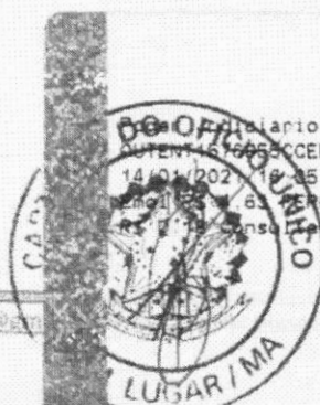
Marlene Silva Miranda Prefeita Municipal

Diário TJMA Selo AUTENT. 676650CEEBTV1QHDL42. 14/01/2021 10:35:39. Ato: 13 18. Total R$ 5,12 E-mail: 63 FISC R$ 0,13 FADEP R$ 0,18 FEMP R$ 7,13 Consulte em https://selo.tjma.jus.br