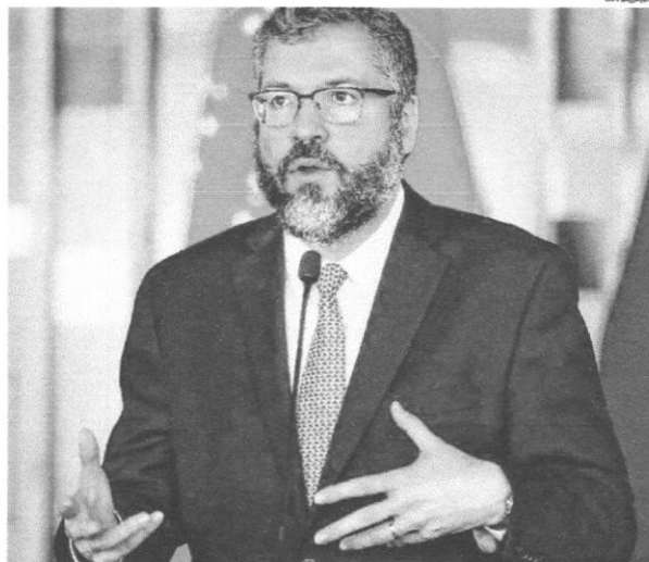
Até o fim de semana, a única saída dada como certa do governo era do então ministro de Ernesto Araújo

José Levi não assinou o documento. Ao analisar o caso, o ministro Marco Aurélio Mello, decano do