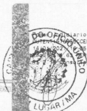
Marlene Silva Miranda Prefeita Municipal

Secretaria de Planejamento e Gestão Tribunal de Contas do Estado do Maranhão 14/01/2021 10:35:38 At: 13 18 Total R$ 5,12 R$ 0,13 PERC R$ 0,13 FADEP R$ 0,18 FEMP R$ 0,18 consulte em https://seio.tjma.jus.br