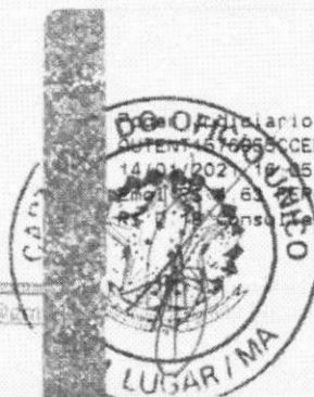
Marlene Silva Miranda Prefeita Municipal

Funcionário TJMA. Selo AUTENT. 167993CCEBTV1QHDLE42. 14/01/2021 10:45:38, Ato. 13 18, Total R$ 5,12 emol. R$ 0,63 FERC R$ 0,13 FADEP R$ 0,18 FEMP RS 0,19 consulte em https://selo.tjma.jus.br