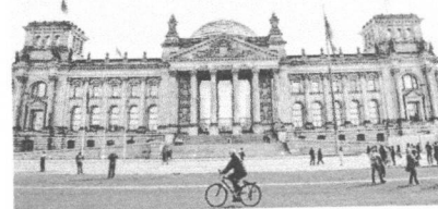
O palácio do Bundestag, sede do Parlamento alemão, em Berlim

Hackers também buscaram dados pessoais de Merkel em uma