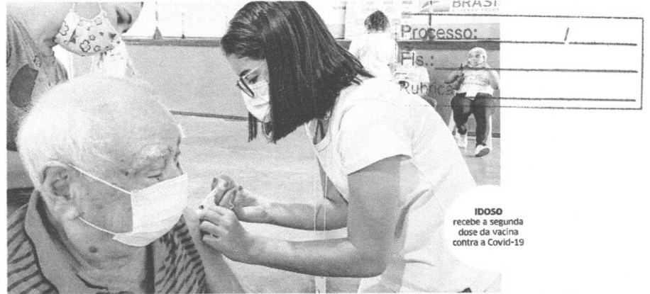
IDOSO recebe a segunda dose da vacina contra a Covid-19

"Eu acho um pouco lento o ritmo da vacinação na capital, por exemplo, na minha casa a minha mãe também é diabética e até que