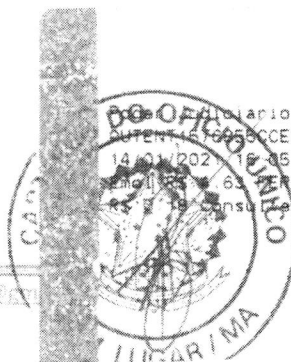
Marlene Silva Miranda Prefeita Municipal

Cam... Apostilado TJMA Seio AUTENTICAÇÃO 6956CCEEBTV1QHOLE42 14/01/2021 17:05:38, Ato: 3 18, Total R$ 5,12 SELO R$ 4,63 PERC R$ 0,13 FADEP R$ 0,18 FEMP R$ 2,19 consulte em https://seio.tjma.jus.br