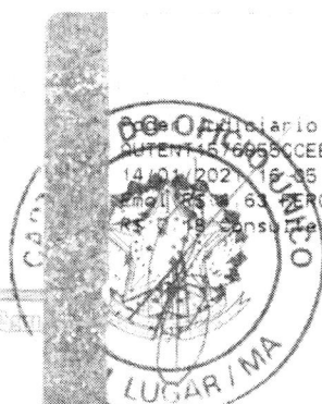
Marlene Silva Miranda Prefeita Municipal

Funcionario TJMA Selo AUTENT 4576650CCEBTV10HDLE42 14/01/2022 16:35:38, Ato: 13 18, Total R$ 5,12 Femp R$ 0,63 FERC R$ 0,13 FADEP R$ 0,18 FEMP R$ 0,19 Consulte em https://selo.tjma.jus.br